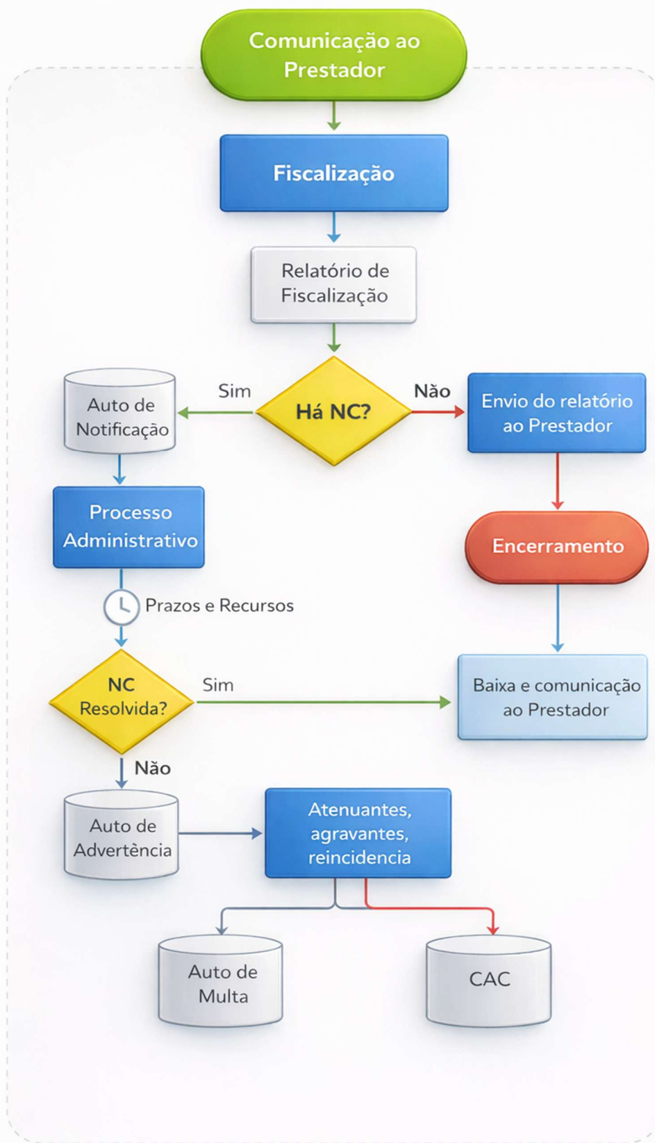
Figura 2 - Fluxograma da fiscalização.