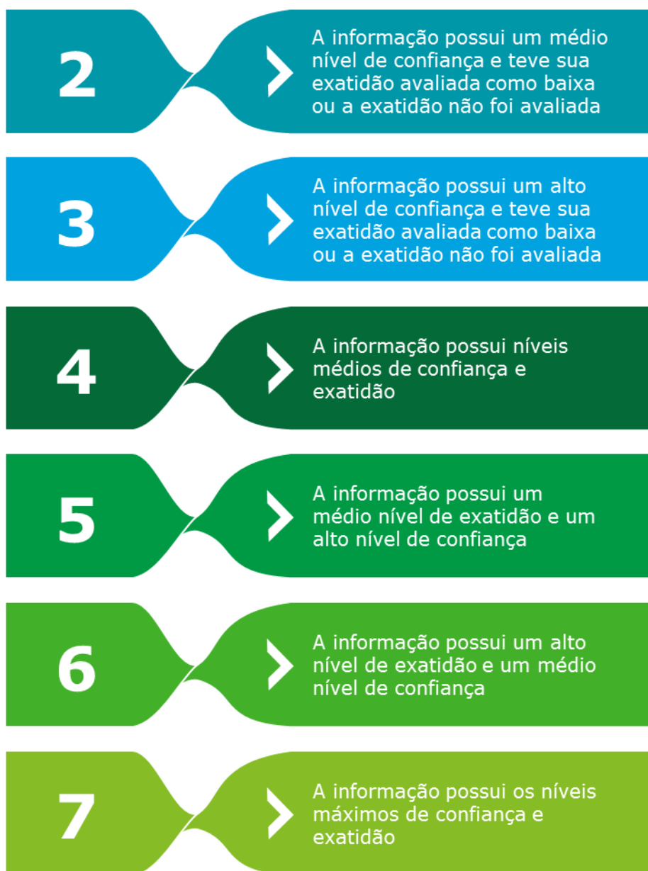
Figura 3 – Descrição das certificações atribuíveis às informações do SNIS