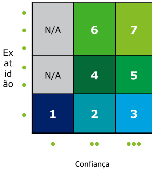
Figura 2 – Matriz de Certificação das Informações do SNIS

Para a certificação final de cada informação, foi realizada a uma combinação dos dois critérios anteriormente citados, a fim de alcançar uma avaliação única, conforme indicado na matriz abaixo: