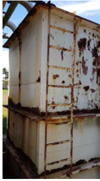
Descrição(7): Estrutura do filtro em estado avançado de oxidação.