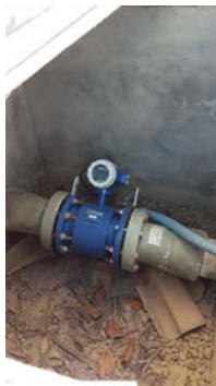
Descrição(9): Macromedidor de entrada da ETA