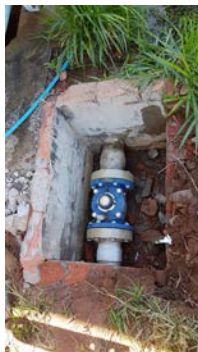
Descrição(10): Macromedidor de saída da ETA