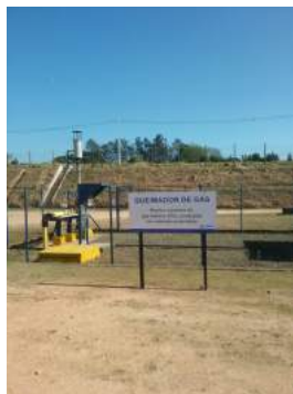
Descrição: Queimador de gás