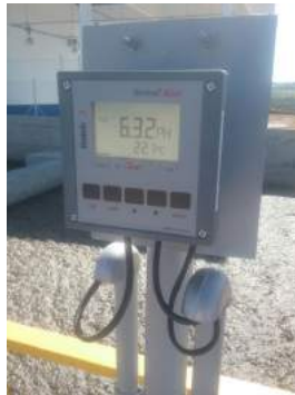
Descrição: Phmetro Imagens(10)