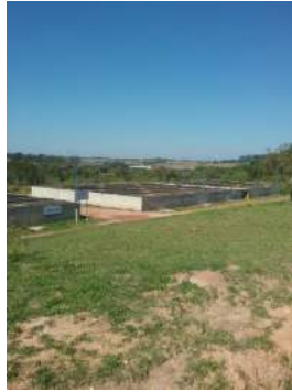
Descrição: Biofiltros anaerobios Imagens(9)