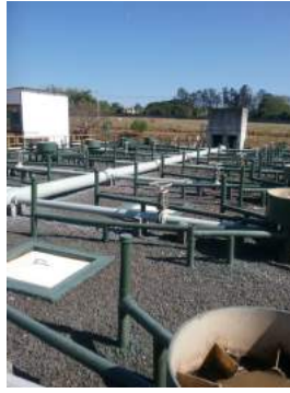
Descrição: Cobertura UASB Imagens(8)