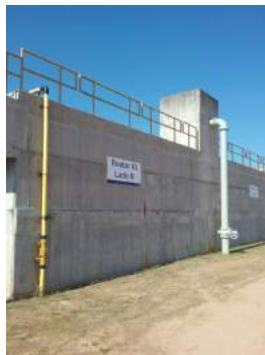
Descrição: UASB Imagens(6)