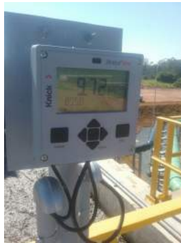
Descrição: Medidor de OD