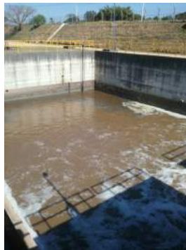
Descrição: Tanque de equalização Imagens(5)