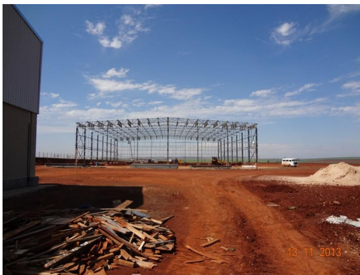
Estrutura montada do Galpão 3.